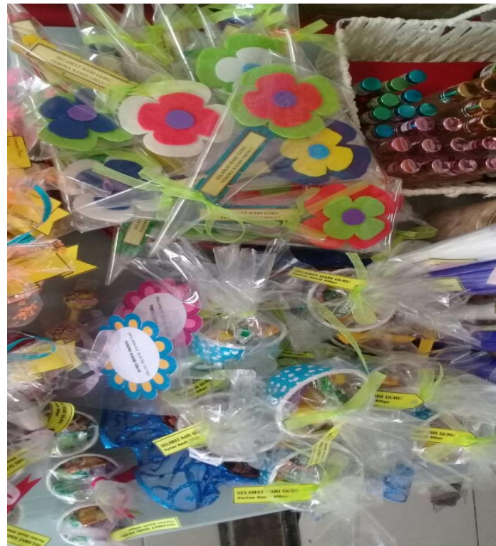
Gambar hasil perkongsian Hanis semasa produknya di jual