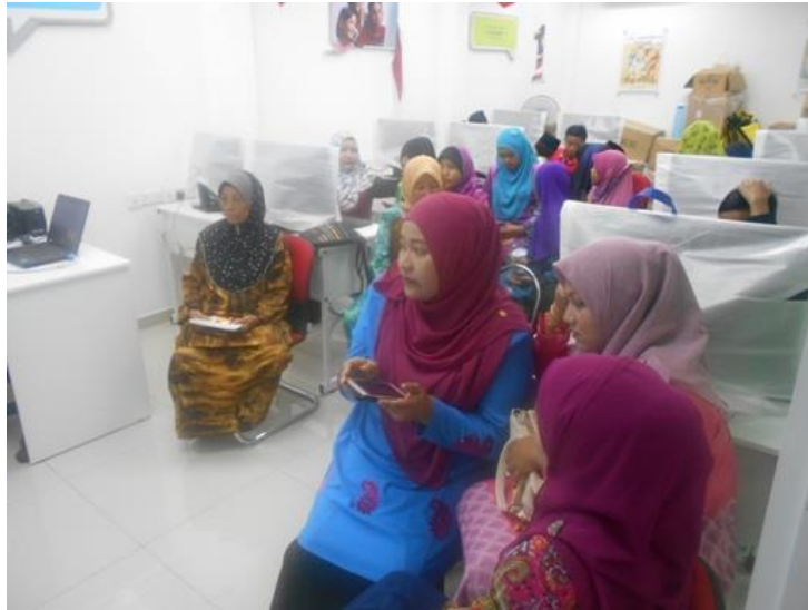
Muat turun aplikasi DK