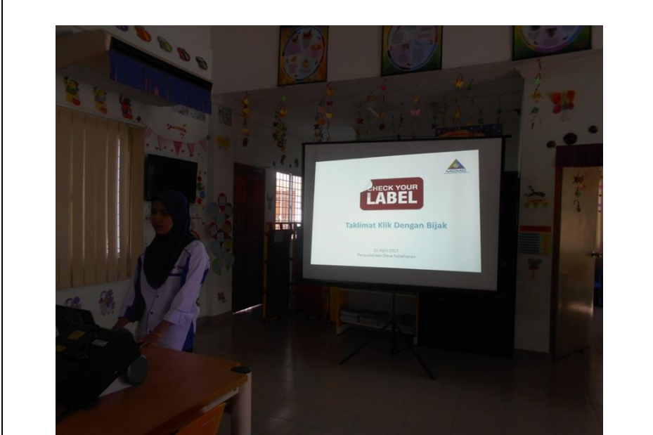
Taklimat Check Your Label