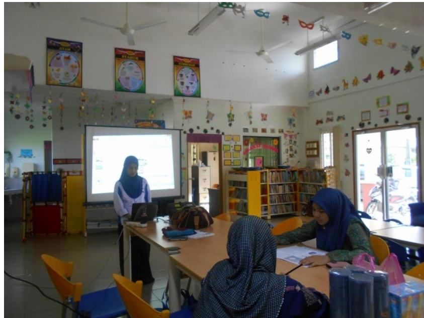
Peserta menjawab kuiz CYL