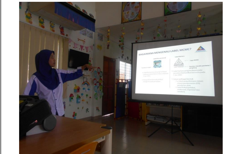
Penerangan kepentingan label MCMC pada peralatan komunikasi