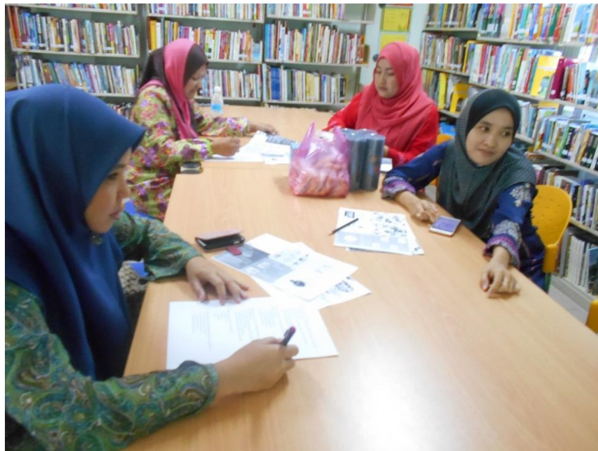
Peserta menjawab kuiz eWaste