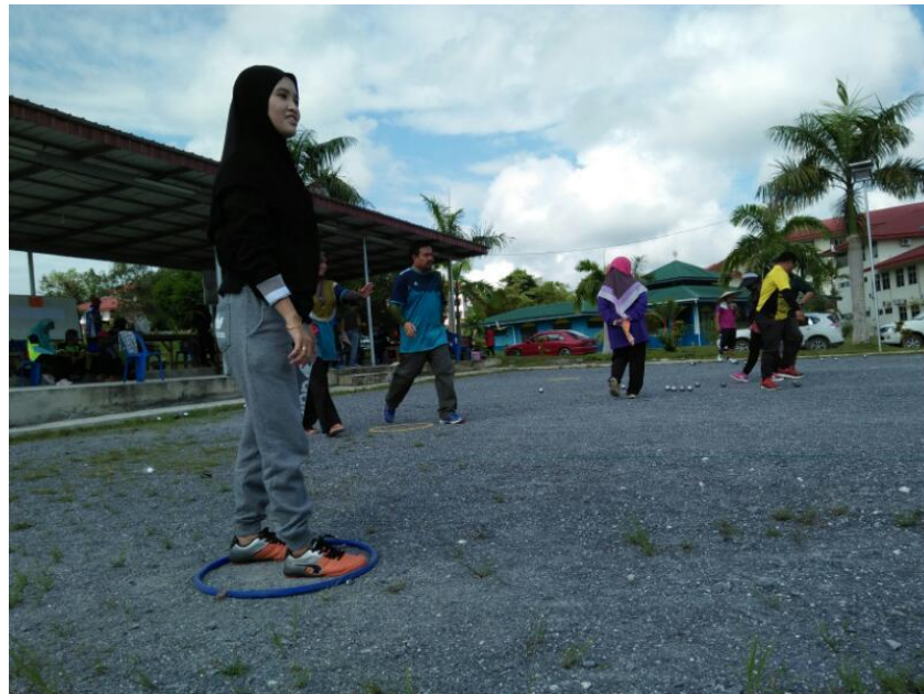
Antara peserta yang bertanding