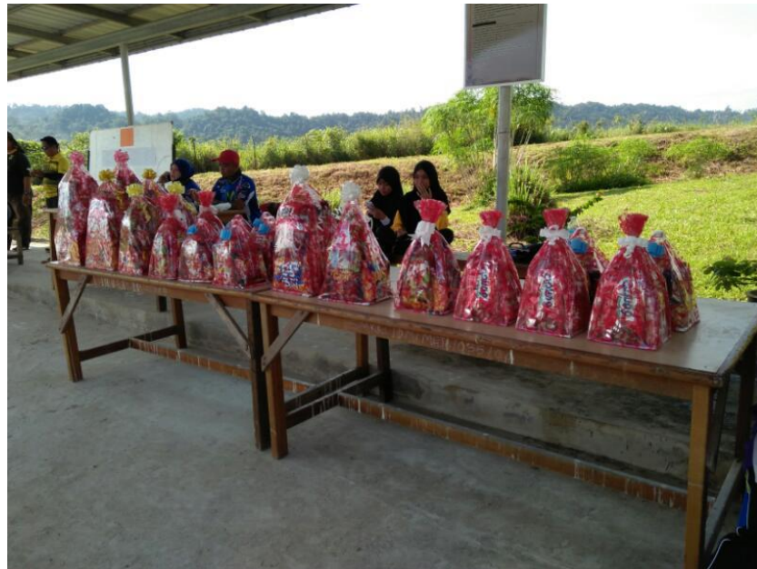
Hadiah sumbang PPWS Cawangan Kg Sekolah