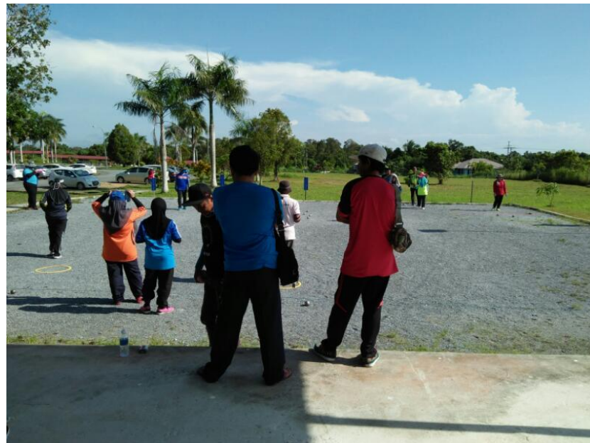
Semasa pertandingan dijalankan